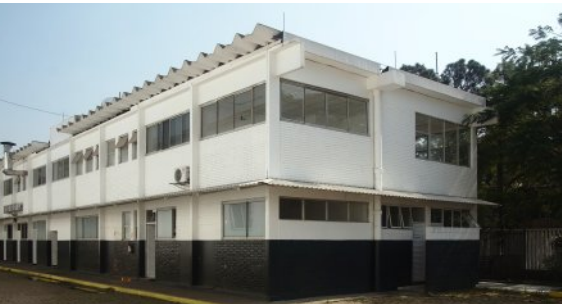
Edifício de apoio: restaurante, vestiários, dormitórios