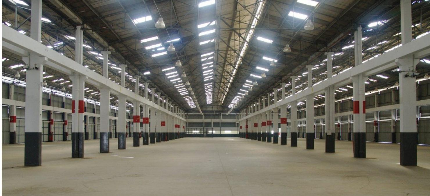
Interior do galpão com ótima iluminação zenital e docas nas 2 laterais e ao fundo