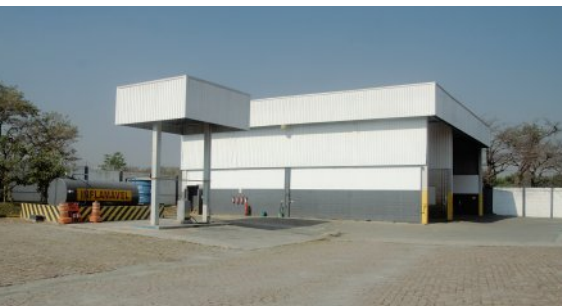
Posto de combustível e oficinas mecânicas