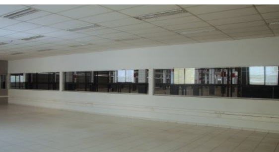
Escritório em área reservada do galpão