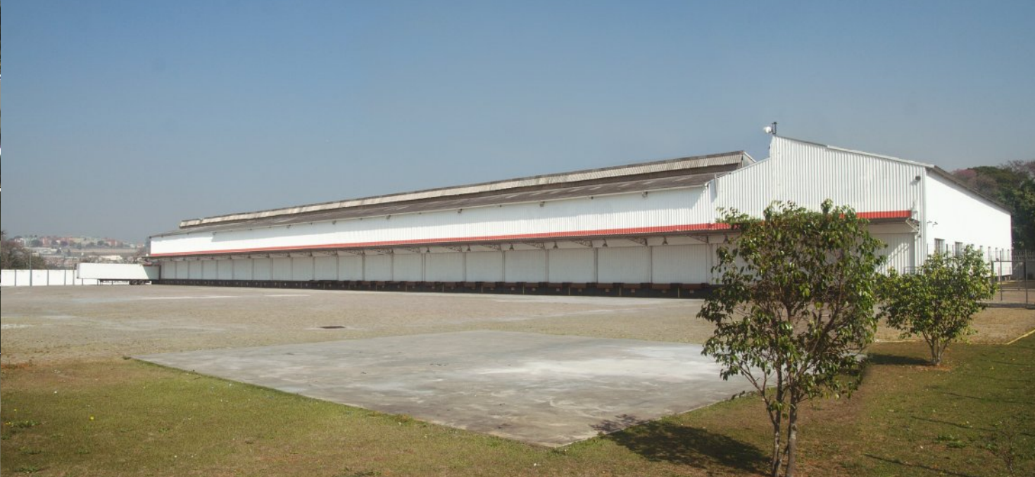
44 docas voltadas para o pátio principal