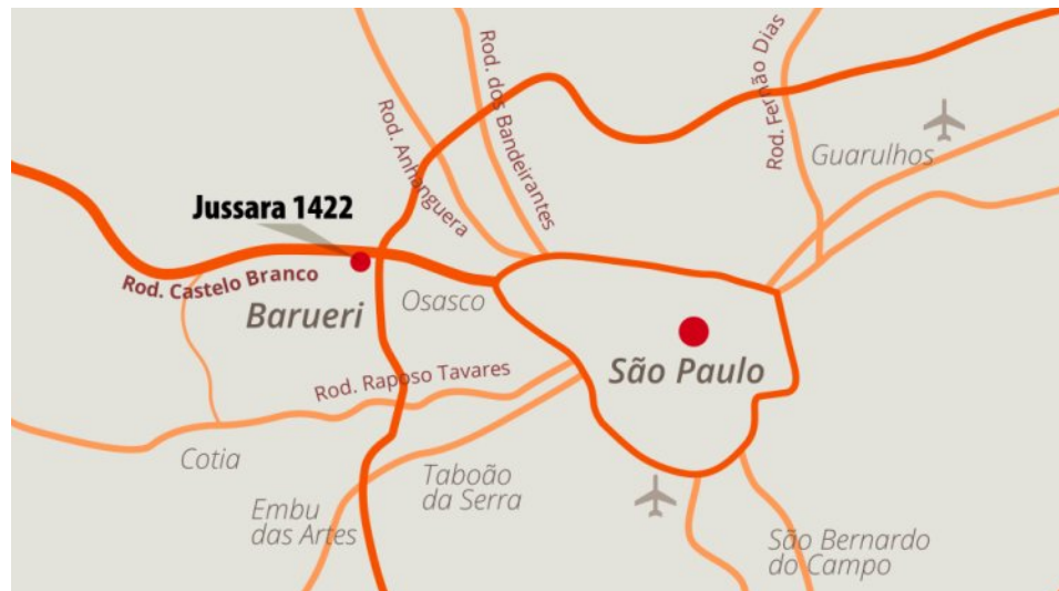
Mapa de localização com principais pontos de referência.