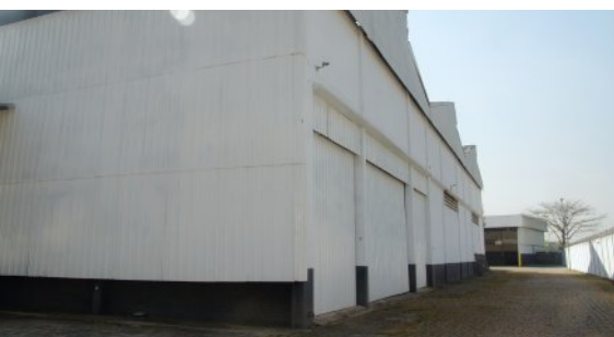
Portas para docas na fachada traseira do galpão