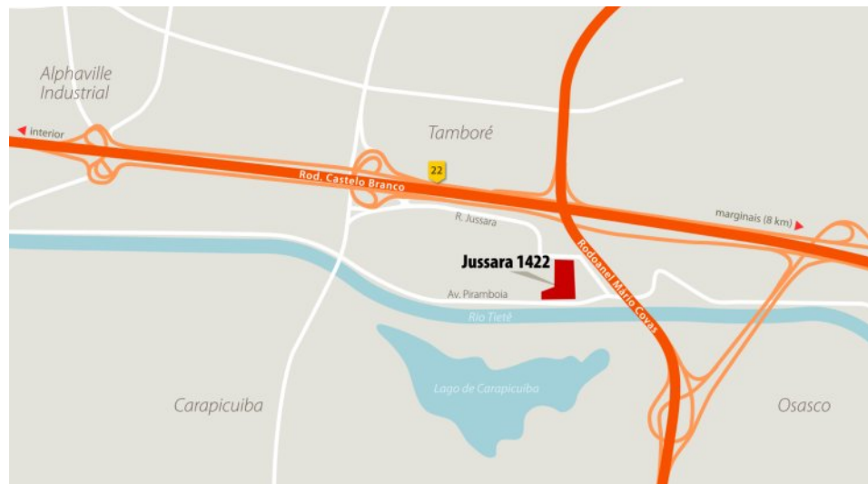
Mapa de localização – proximidades.