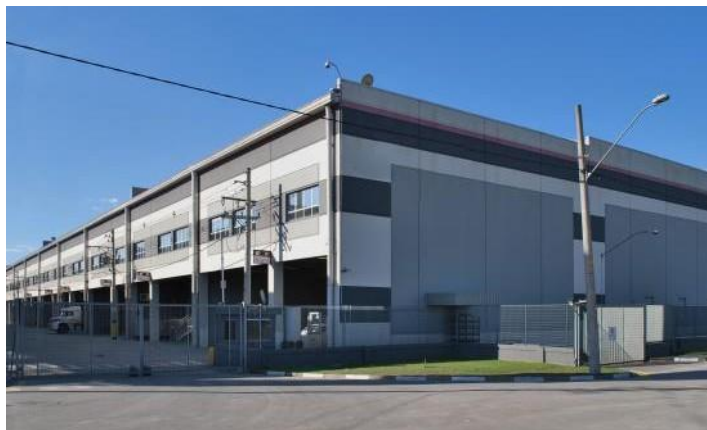
Fachada Modular I