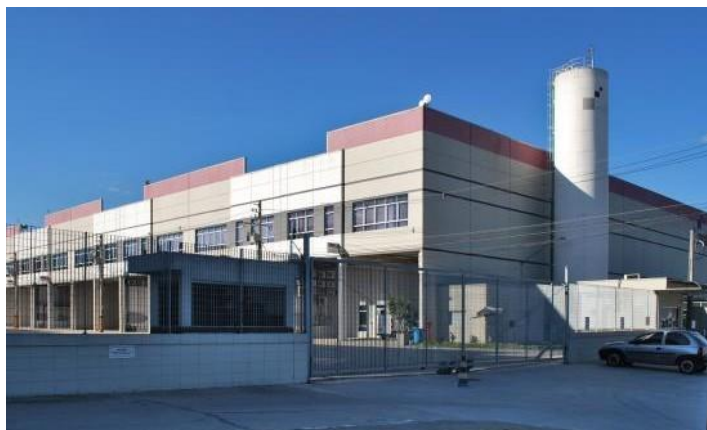
Fachada Modular II