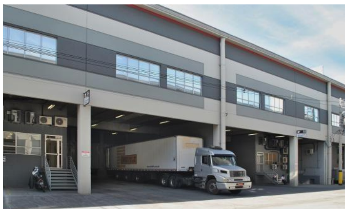
Vista do pátio - Modular I