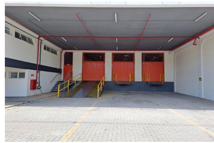
Vista Docas - Modular RT 28