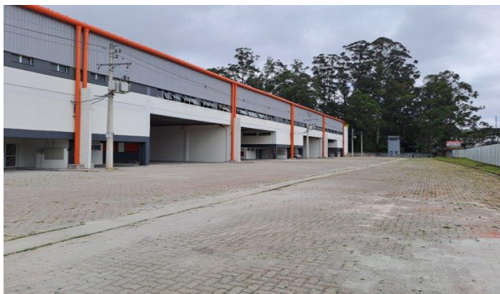
Fachada e Rua Interna Modular RT 28