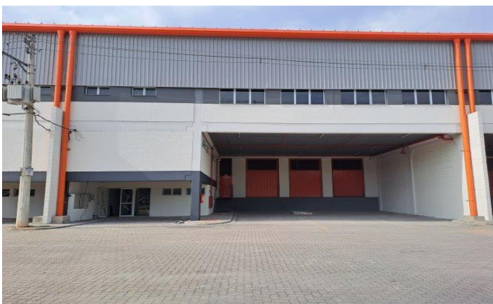
Vista da Fachada Módulo Padrão - Modular RT 28