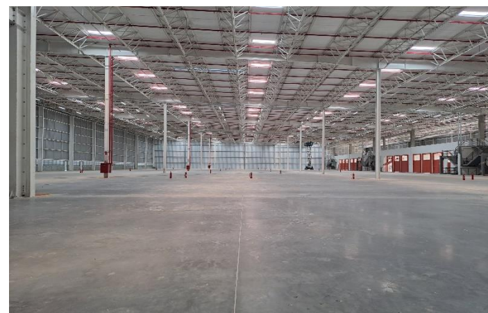
Vista Interna - Modular RT 28